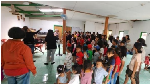
Figur 3: Kegiatan Anak lewat Metode Cerita