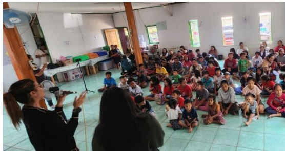
Figur 4: Kegiatan sosial dan emosional anak

Perkembangan sosial dan emosional anak-anak mempengaruhi bagaimana mereka berhubungan dengan orang lain, mengelola emosi mereka, dan menanggapi dunia di sekitar mereka. Selain itu, ada korelasi antara kemampuan sosial dan emosional ini dan kapasitas untuk mengekspresikan perasaan seperti kebahagiaan, kesedihan, kecemasan, dan kemarahan dengan tepat. Keterampilan ini juga membantu anak-anak dalam mencari tahu bagaimana berperilaku ketika mengalami emosi ini. Selain itu, melalui berlatih keterampilan sosial dan emosional dengan teman sebaya dan guru, anak-anak dapat memperoleh wawasan tentang identitas dan perasaan mereka sendiri. 4 Kompetensi sosial dan emosional, menurut Wu, et al. adalah kemampuan untuk menggunakan perilaku yang dapat diterima secara sosial untuk membangun hubungan positif dan bersosialisasi dengan orang lain. 5 Menurut Denham, Bassett, Mincic et al.,