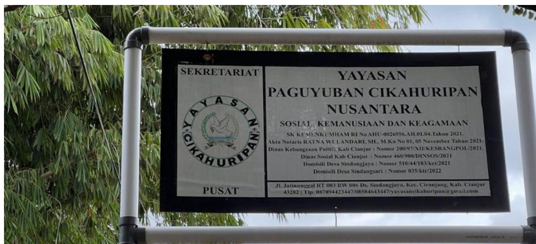
Figur 9. Plang Nama Yayasan Paguyuban Cikahuripan Nusantara

Implementasi program pendidikan oleh Yayasan Paguyuban Cikahuripan Nusantara telah memberikan dampak yang signifikan bagi anak-anak dan masyarakat. Anak-anak yang mengikuti program yayasan menunjukkan peningkatan dalam prestasi akademik, kreativitas, dan perilaku sosial. Selain itu, program pendidikan berbasis budaya telah berhasil menumbuhkan rasa cinta dan kebanggaan terhadap budaya lokal. Masyarakat juga merasakan manfaat dari program ini, dengan semakin meningkatnya partisipasi dan dukungan mereka terhadap kegiatan-kegiatan yayasan.