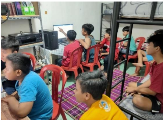
Figur 5. Kegiatan pembelajaran di komputer

tua dan guru bertanggung jawab untuk mengawasi pembelajaran kooperatif di rumah. Untuk berpartisipasi dalam masyarakat, seseorang harus mampu berkomunikasi. 14 Kegembiraan siswa dalam menyelesaikan suatu kegiatan berdampak pada keterampilan ini. Guru memanfaatkan film pembelajaran khusus kurikulum dan lembar kerja siswa untuk memfasilitasi pembelajaran kooperatif. Strategi persuasif digunakan untuk membuat program yang mengajak masyarakat berpartisipasi dalam pelaksanaan program yang direncanakan, sedangkan strategi partisipatif lebih sering digunakan untuk membuat program kreatif yang berpusat pada pengembangan keterampilan hidup masyarakat (pelatihan). 15