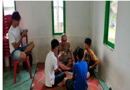
Figur 2: Kegiatan pembelajaran sharing