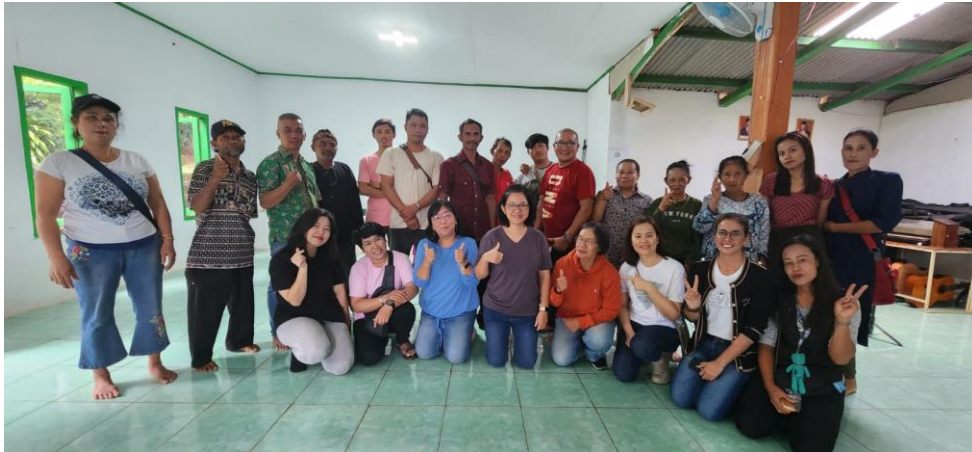
Figur 10. PkM di Yayasan Paguyuban Cikahuripan Nusantara

tidak lepas dari dukungan masyarakat dan dedikasi para relawan yang terlibat. Diharapkan, dengan terus berjalannya program-program ini, semakin banyak anak-anak yang mendapatkan manfaat dan memiliki masa depan yang lebih cerah.