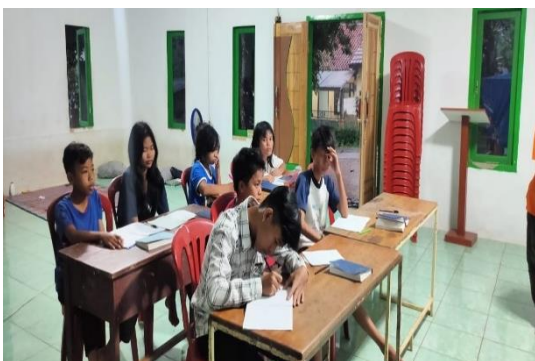
Figur 7. Kegiatan pembelajaran kelas