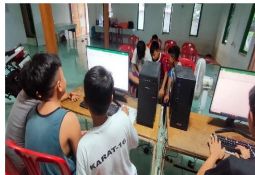
Figur 8. Kegiatan pembelajaran games

Mulyasa yang dikutip oleh Hidayati menyatakan bahwa partisipasi warga belajar dalam pembelajaran sering juga diartikan sebagai keterlibatan warga belajar dalam perencanaan, pelaksanaan, dan evaluasi pembelajaran. Perencanaan kegiatan