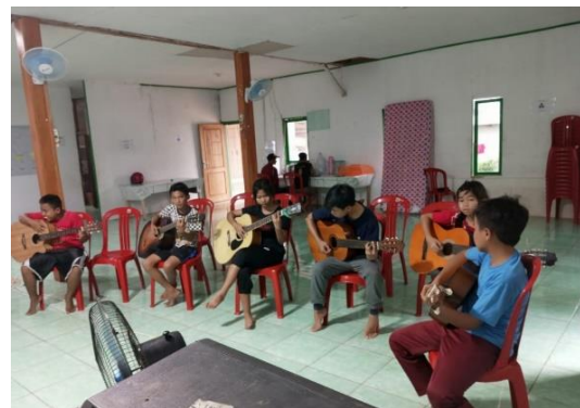
Figur 6. Kegiatan pembelajaran musik