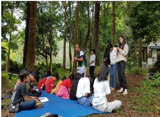
Figur 1: Kegiatan pembelajaran di alam

utama, rasa hormat, dan pemahaman tentang peristiwa keluarga, sambil mengakui pentingnya emosi dan bagaimana mengendalikannya untuk pertumbuhan anak yang sehat.