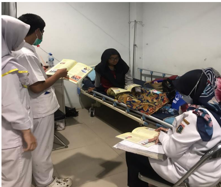
Figur 5. Ceramah Materi pijat laktasi dan tehnik hipnobreastfeeding