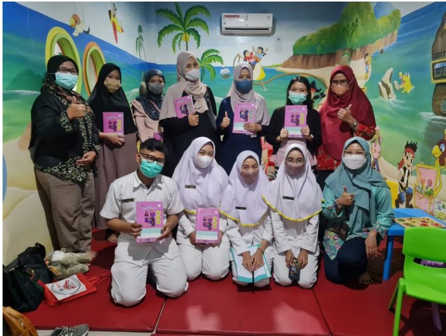
Figur 6. Peserta Pengabdian kepada masyarakat

Para ibu terlihat sangat intens saat mengikuti sesi latihan. Banyak pertanyaan yang muncul, terutama ketika data dan pengalaman disajikan. Hasil Pengamatan menunjukkan para ibu belum mengetahui secara detail. Secara khusus, kegiatan ini di selenggarakan dengan maksud dan tujuan agar para ibu mampu memberikan pijat laktasi dan tehnik hipnobreastfeeding baik bagi dirinya sendiri maupun orang yang ada disekitarnya yang membutuhkan ilmu tersebut. Hal ini merupakan hasil analisa terhadap permasalahan yang ditemui antara lain kurangnya pemahaman dan keterampilan para ibu dalam manajemen laktasi, kurangnya pemahaman dan keterampilan para ibu dalam tehnik pijat laktasi dan tehnik hipnobreastfeeding.