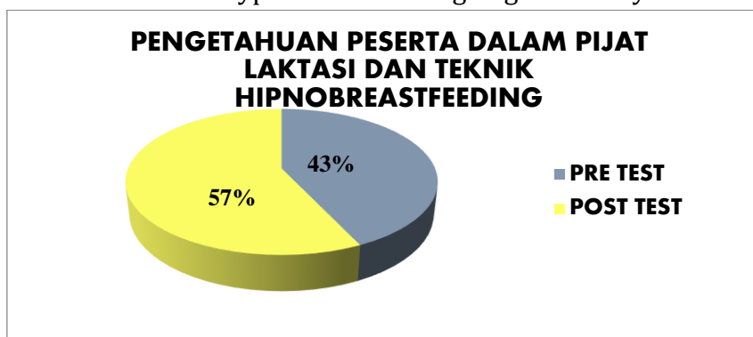
Figur 3. Hasil evaluasi pengetahuan peserta tentang Pelatihan Pijat Laktasi Dan Teknik Relaksasi Hypnobreastfeeding Bagi Ibu Menyusui