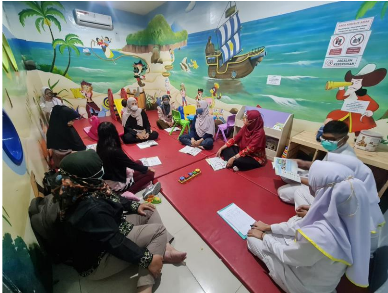
Figur 4. Ceramah Materi tentang Air Susu Ibu

Hasil evaluasi ini diberikan kepada setiap peserta dalam bentuk skor, yaitu hasil jawaban benar dibagi jumlah soal dikalikan 100. Proses evaluasi dilakukan dengan memeriksa jawaban peserta atas pertanyaan-pertanyaan. Umpan balik diminta atau diberikan selama diskusi dan latihan. Penilaian akhir dilakukan dengan memberikan post-test kepada peserta yang terdiri dari soal-soal yang sama dengan pre-test . Skor post test dibandingkan dengan skor pre test . Jika skor post test lebih tinggi dari skor pre test , maka ukuran metodologi yang diberikan berhasil meningkatkan pengetahuan peserta.