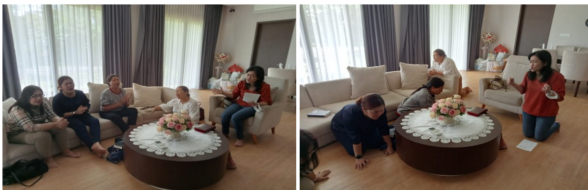
Gambar 4. Doa Bersama

Pelayanan Firman ini dilaksanakan di gedung GBI CBM Ganggeng oleh penulis, pada tanggal 15 November 2023.