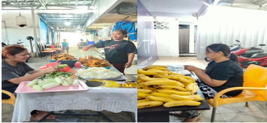
Figur 5. Chatering

Doa bersama ini, penulis lakukan dengan Ibu gembala dan beberapa perempuan dari persekutuan Wanita Bethel Indonesia (WBI), di rumah salah satu anggota jemaat, pada tanggal 6 April 2023.