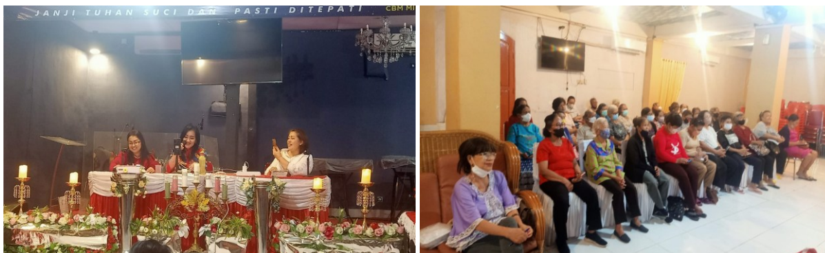
Figur 3. Pelayanan Sharing Firman di Ibadah WBI